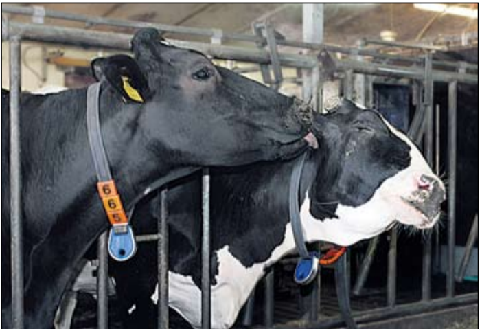
Toisen lehmän nuoleminen vahvistaa eläinten välistä sidettä.

Lehmät lähettävät jatkuvasti ympärilleen signaaleja. Näitä signaaleja havainnoimalla ja oikein tulkitsemalla eläinten hoitaja saa monenlaista tärkeää tietoa esimerkiksi niiden hyvinvoinnista. Tällä tavoin tila voi saada aikaan merkittäviä säästöjä.